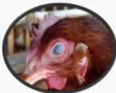
помутнение роговицы и слепота