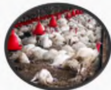
отказ от корма и гибель