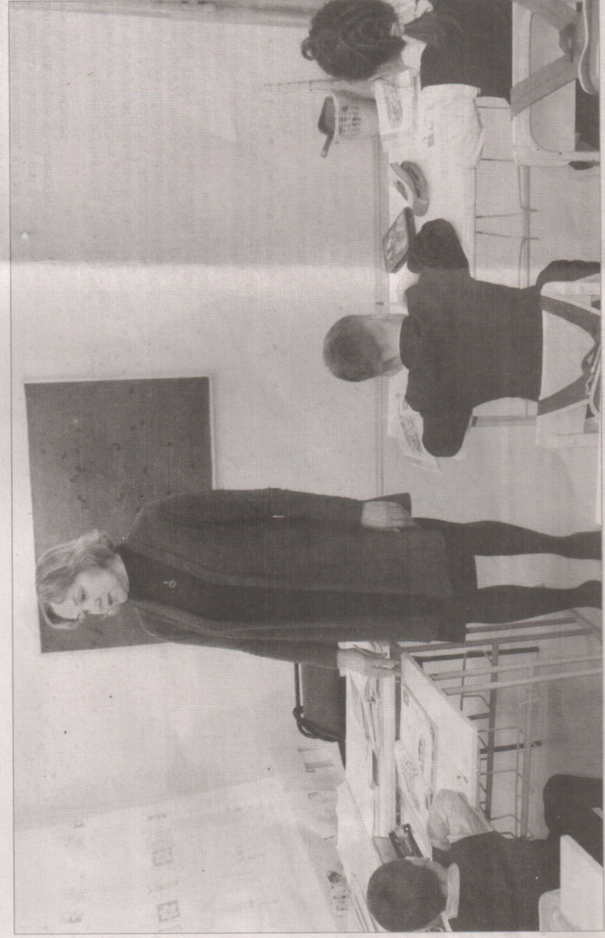
Для трошкнских первоклассников выделили отдельную классную комнату.

Общественно-политическая газета Благовещенского района Республики Башкортостан. Выходит во вторник и пятницу.